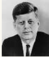
2 Un homme