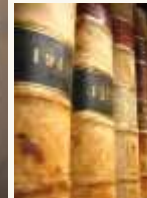
22 Des livres