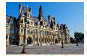
15 Un hôtel de ville