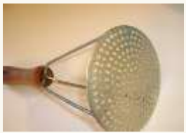
7 Un ustensile de cuisine