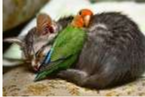
3 Un perroquet et un chat