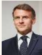
10 Un Président