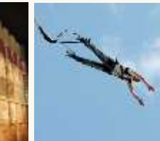
23 Un sport