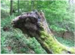
1 Une souche

Exemple : Un avion – Cet avion est un airbus / cet avion a quatre réacteurs / cet avion va à Paris / etc.