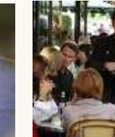
20 Un garçon de café