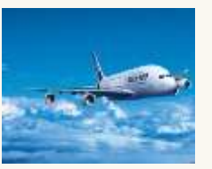
12 Un avion