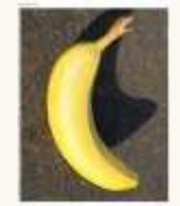
8 Un fruit