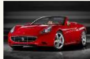
9 Une voiture