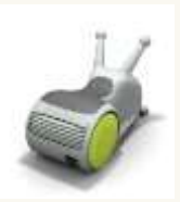
14 Un aspirateur