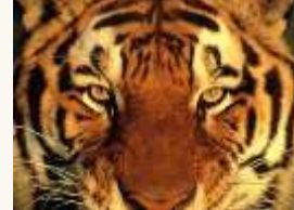
5 Un animal