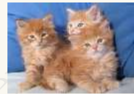
11 Des animaux