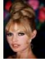
4 Une femme