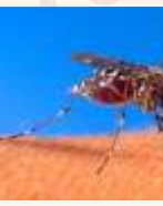
16 Un insecte