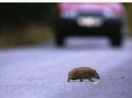
19 Un hérisson