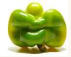
6 Un poivron vert