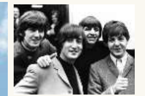
24 Des musiciens