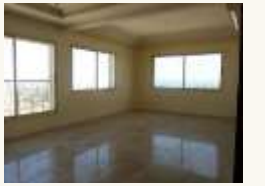
13 Un appartement