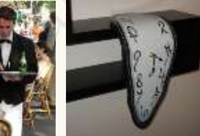
21 Une horloge