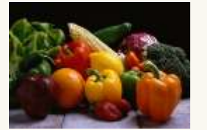
18 Des légumes